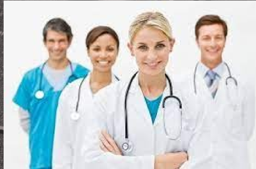
You can simply impress your audience.